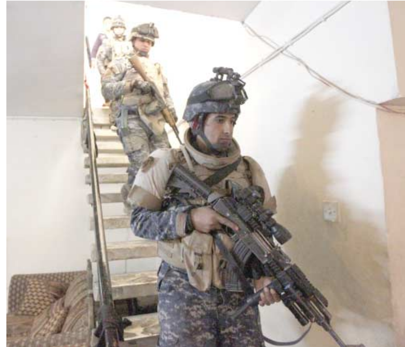
تفتيش؛ جنود عراقيون يفتشون حملة تفتيش في بغداد.

بغداد - زينة سامي طالب مجلس شيوخ وعشائر صلاح الدين الحكومة باغلاق السفارة الإيرانية ببغداد وطرد سفيرها بعد التصريحات التي اياها قائد الحرس الثوري الإيراني قاسم سليماني. وقال المجلس في بيان تلقته (الزمان) امس ان (التصريحات التي اطلقها سليماني تعد اهانة لجميع ابناء العراق وعربين عن (استغرابهم مما اسموه الصمت الحكومي تجاه مثل تصريحات كهذه وعدم السماح للنظام الإيراني بالتدخل في الشأن الداخلي للبلاد).