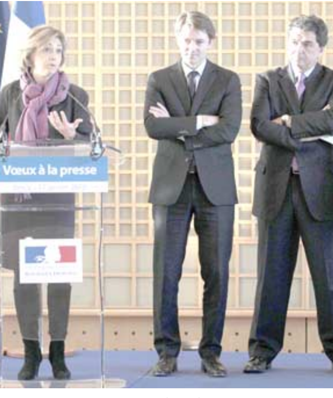
مؤتمر صحفي: وزيرة المياني الفرنسية تعقد مؤتمراً صحفياً مع وزير الاقتصاد في باريس

والتقى جيلاني مع أعضاء المحكمة العليا الباكستانية، وذلك في خطوة تهدف إلى إظهار حسن النية. وقال جيلاني، "أنا لست أرى نفسي مسؤولاً عن الفساد، ولكنني أرى أن الفساد في باكستان هو نتيجة لعدم الشفافية في العمل الحكومي". وقال جيلاني، "أنا لست أرى نفسي مسؤولاً عن الفساد، ولكنني أرى أن الفساد في باكستان هو نتيجة لعدم الشفافية في العمل الحكومي".