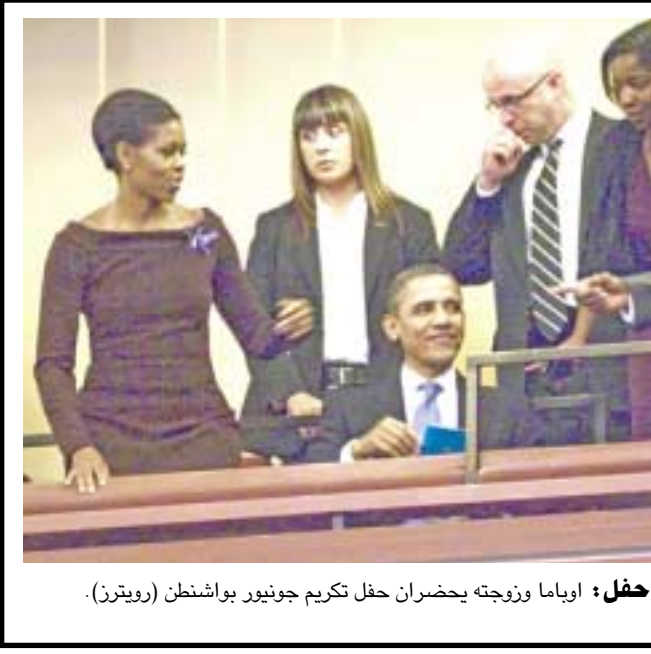
حفلة: أوباما وزوجته يحضران حفل تكريم جونيو بوشنن