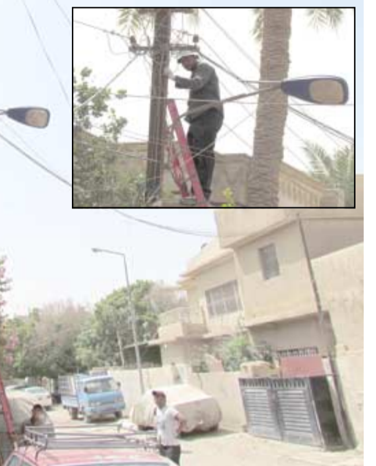
أعمدة : اعمدة انارة الشوارع تشهد اهماً كبيراً حيث اصبحت مرماً لاسلاك المودات ومرتمجا لعشاش الطيور